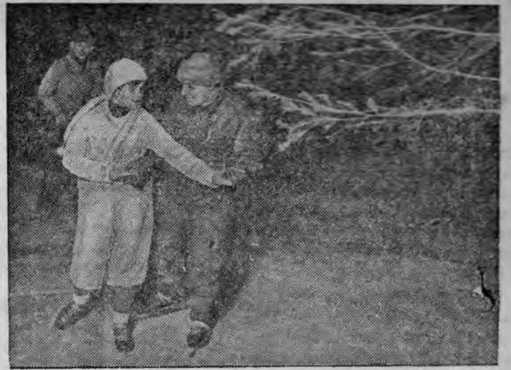
Вечером на Хабаровском катке «Динамо».

Повару Шиманович, недобросовестно относившейся к приготовлению пищи, объявлен выговор. Пом. повара Шегутова переведена из столовой на другую работу.